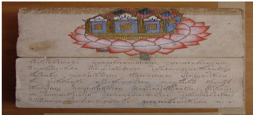
รูปที่ 1 ศาสตร์ ฉบับตำบลดงขี้เหล็ก อำเภอเมือง จังหวัดสงขลา

ลักษณะคำทำนายในทางดีของวรรณกรรมศาสตร์ ฉบับตำบลดงขี้เหล็ก อำเภอเมือง จังหวัดสงขลา มีจำนวน 31 ตอน ดังตัวอย่างเช่น